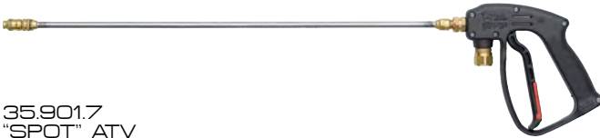
35.901.7 "SPOT" ATV