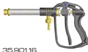
35.901.16 "SPOT" 300