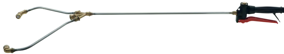
3.901.8 SCARABEO / SCARAB