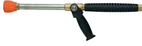
22.1617.11 22.1617.73 sotto insieme lavaggio washing subassembly